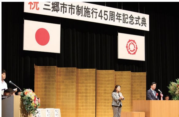
三郷市市制施行45周年記念式典にて