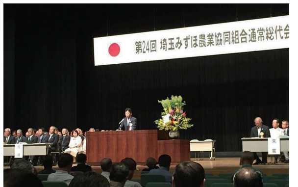
埼玉みずほ農業協同組合通常総代会にて