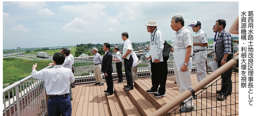
葛西用水路土地改良区理事長として水資源機構・利根大堰を視察