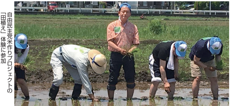
自由民主党米作りプロジェクトの「田植え」体験に参加