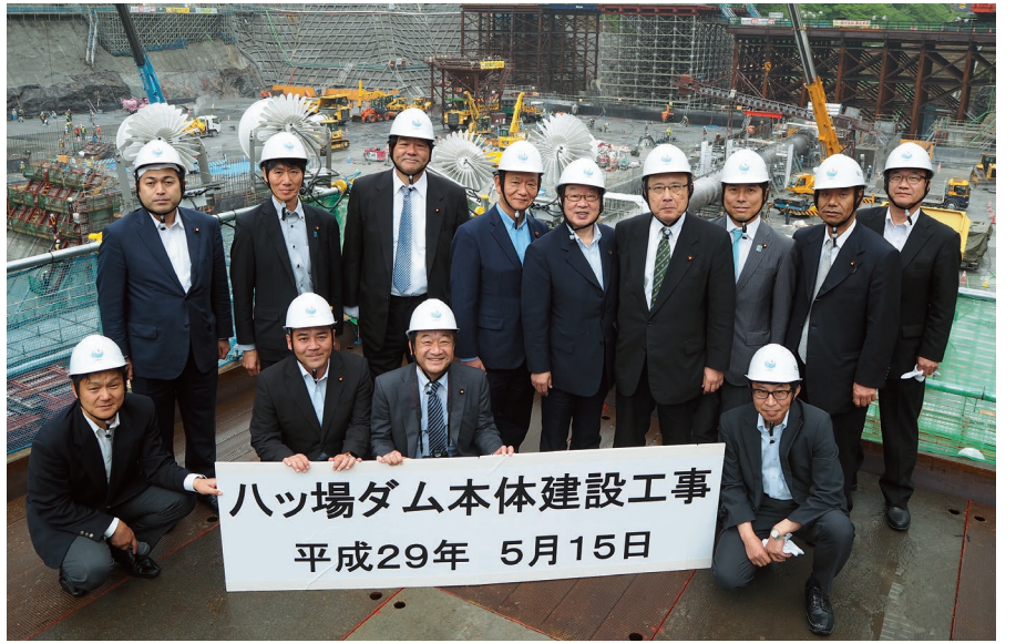
自由民主党治水議連によるハツ場ダム工事現場の視察