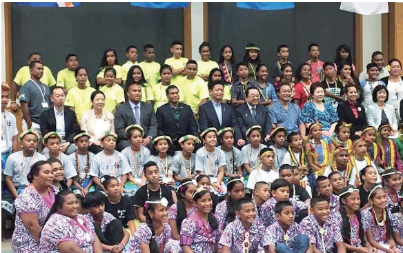
ミクロネシア諸島自然体験交流事業歓迎会