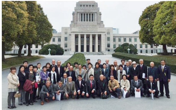
後援会役員の皆様と国会議事堂正面にて