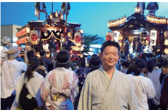
幸手市八坂祭りにて