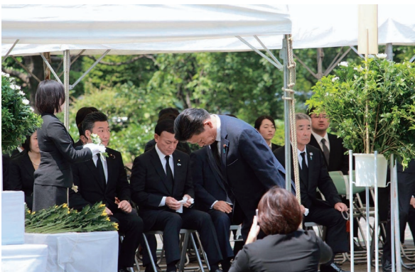
千鳥ヶ淵戦没者墓苑での遺骨引渡式に自由民主党を代表して参列