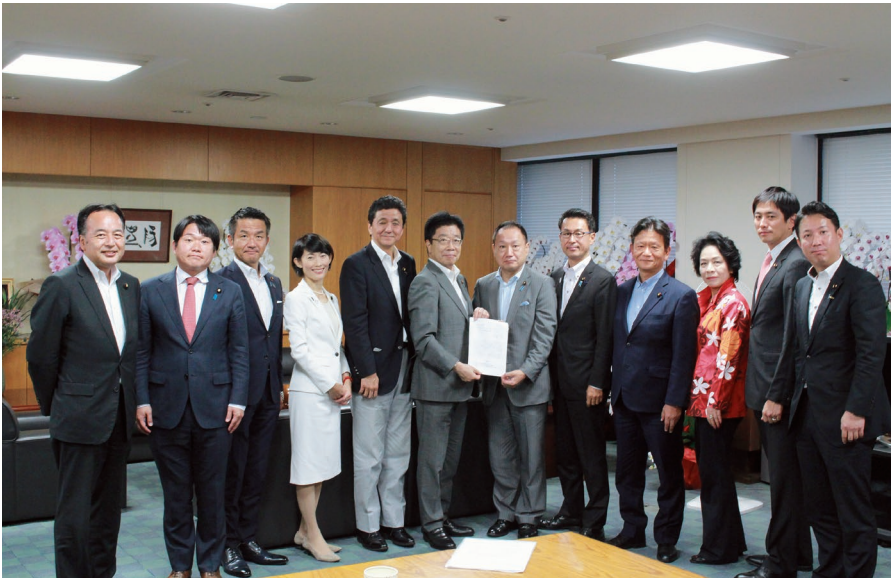
歯科医療の推進へ向けて、就任された加藤勝信厚生労働大臣（左から6人目）へ陳情活動