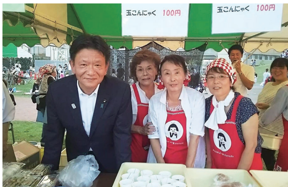
八潮市夏祭り夜市にて