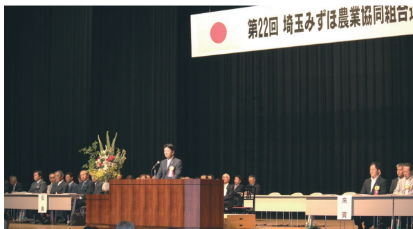
埼玉みずほ農業協同組合の総会。強い農業と美しく活力ある農村の創出に取り組んでまいります