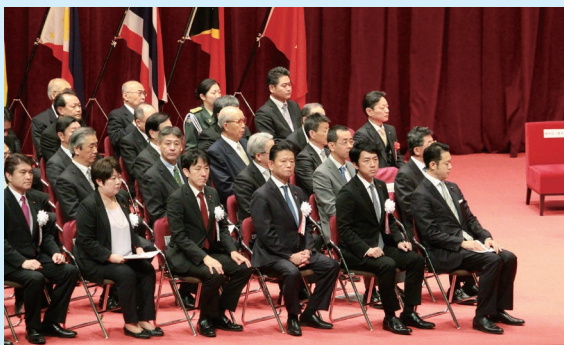
防衛大学校卒業式に出席