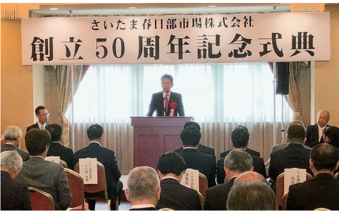
さいたま春日部市場株式会社 創立50周年記念式典