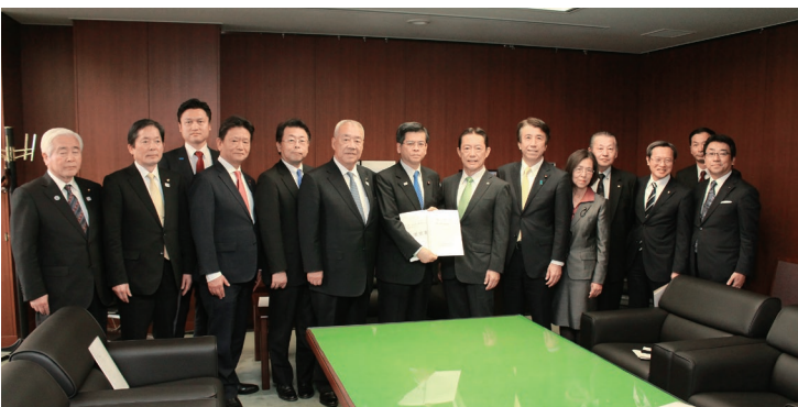
三郷流山橋建設に向けて、石井啓一国土交通大臣に強く要望