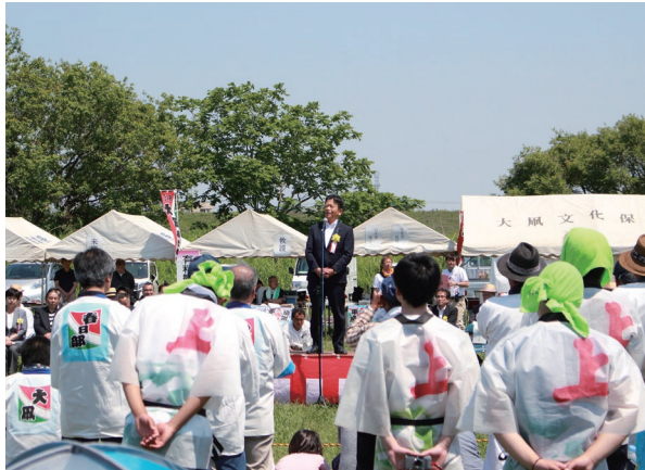
春日部・庄和の大凧あげ祭り

久喜市で開催された「自民党・米作りプロジェクト」農政を語るには実践から食に対する感謝や農業の大切さを発信