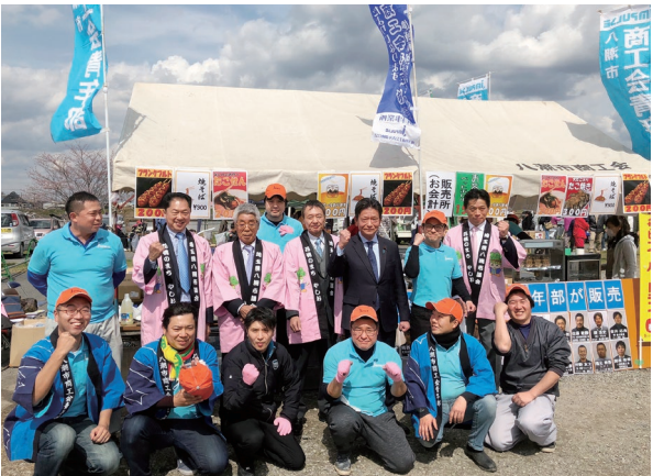
川野駅・中川やしお花桃まつり