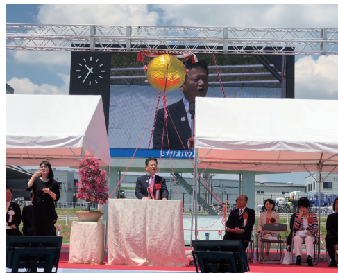
三郷市陸上競技場・セナリオハウス フィールド三郷の完成記念式典