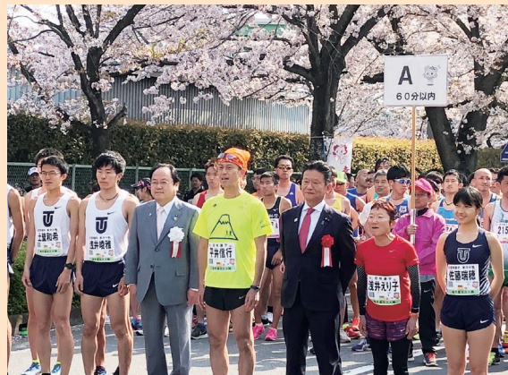
幸手市のさくらマラソン大会の開会式 日本一の美しさを誇る権現堂の桜並木の下で