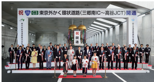
地元を貫く幹線道路である外環道が埼玉から千葉まで遂に完成。埼玉県側の地元を代表して完成式典でテープカットに臨む