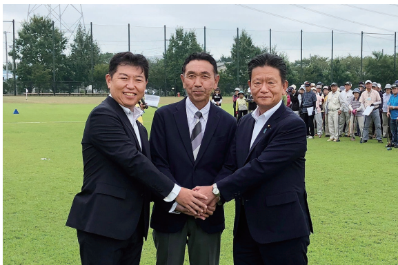
梅澤佳一杯ゴルフ大会開会式。国・県・市が一体となって健康寿命などの課題解決に努めます