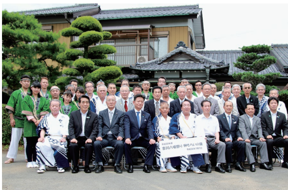
吉川市八坂まつり榊奉納の儀。地域の皆様とともに