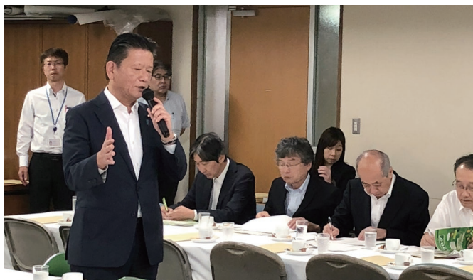
自民党厚生労働部会副会長として活発に議論を展開