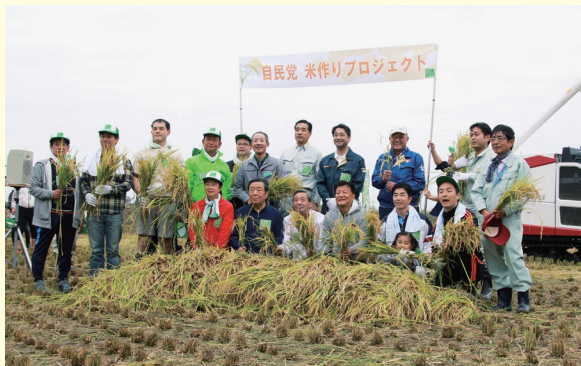
久喜市で行われた「自民党米作りプロジェクト」での稲刈り。農業が国の基であることを改めて実感。本プロジェクトにはサブマネージャー（事務局長）として携わり、黄金色に実った埼玉県のブランド米「彩のきずな」を収穫