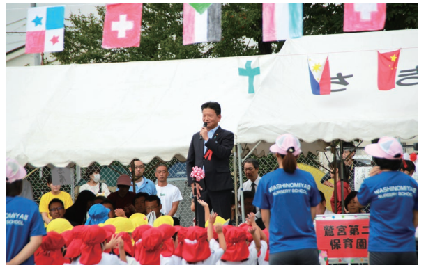
久喜市鷺宮第二保育園の親子運動会。子供たちの元気な行進、ご家族の声援、秋の清々しい一日でした