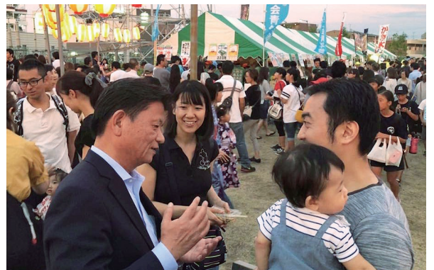
八潮の夏祭り。若い世代の流入が著しい八潮市。子育て世代にやさしい政策を強力に推進します