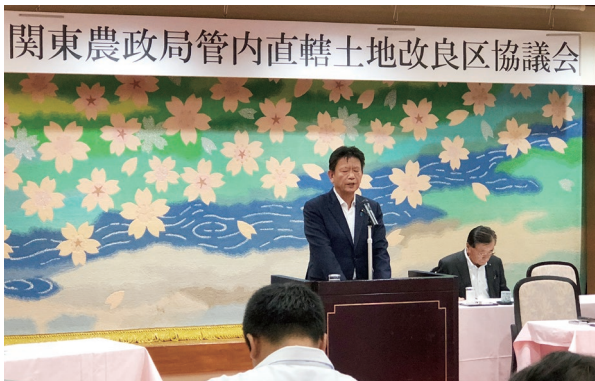
関東農政局管内直轄土地改良区協議会総会。農業の将来を見据えた土地改良整備に取り組みます