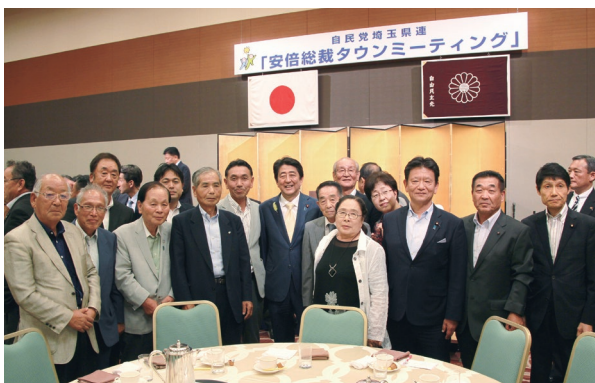
自民党埼玉県連の「安倍総裁タウンミーティング」。安倍晋三総裁を囲んで、地元の皆様とともに