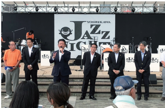
吉川ジャズナイトフェスティバル開会式。商工会青年部を中心とした手づくりの運営