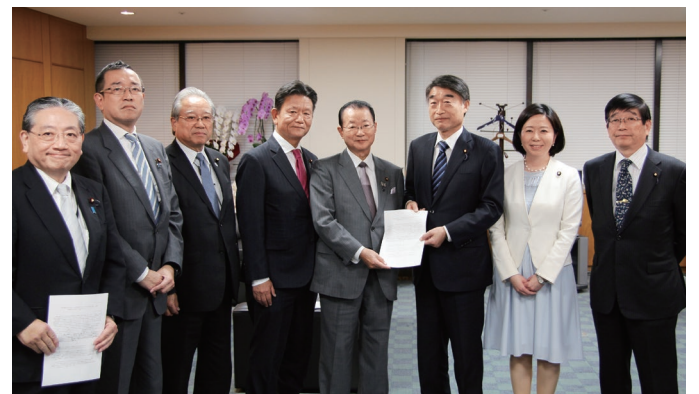
医師偏在是正を求める議連で根本匠厚生労働大臣へ申し入れ 厚生労働大臣室にて