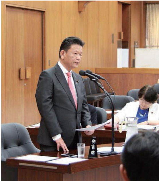
厚生労働委員会、医療法、医師法の一部を改正する法律案に対して自民党を代表して質問。医師偏在、診療科偏在を是正するための初めて強制力を持った法案であり、先の国会にて成立させることが出来ました。