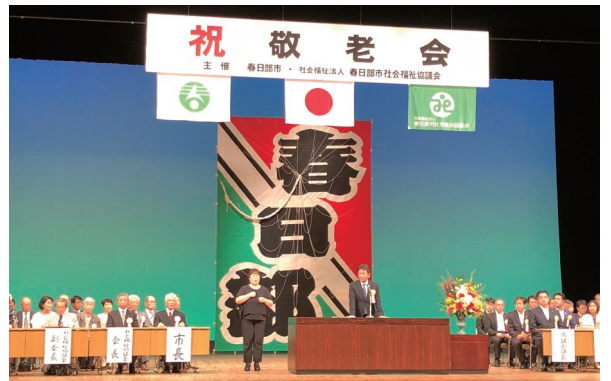
春日部市敬老会。庄和の大凧を背に挨拶。会場の皆様に心より敬意と感謝をお伝えする