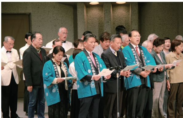
松伏町民文化祭セレモニーにて地元のみなさまと合唱