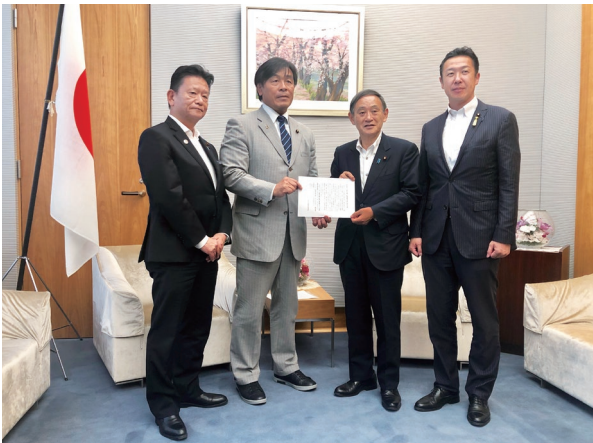
オウム対策議連事務局長として 菅義偉内閣官房長官にテロ対策強化等を申入れ