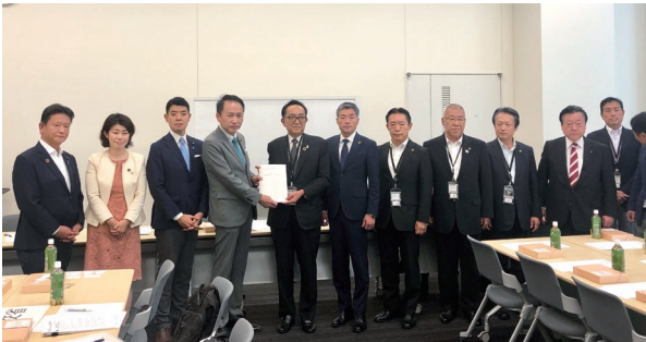
つくばエクスプレス議連事務局長として 東京駅延伸と8両編成化早期実現に取り組みます