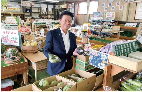
JA さいかつ農産品直売所にて 生産者の顔の見える野菜に対し愛情を感じます