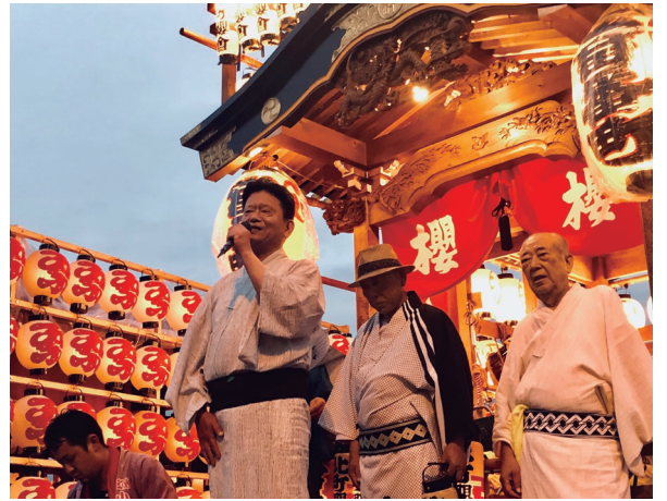
幸手の八坂夏まつり「花山」 きらびやかに居並ぶ山車に乗ってあいさつ