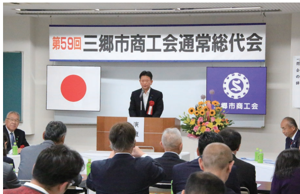
三郷市商工会議所総会にて 地元を支える中小企業の皆様の声をしっかり国政に届けます