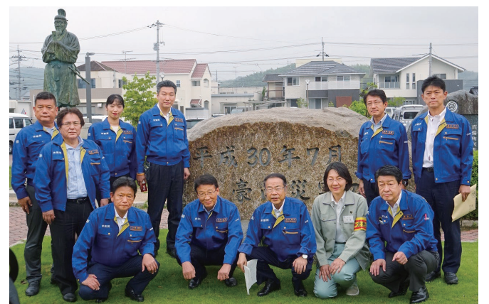
衆議院災害対策特別委員会として、豪雨災害が頻発する中、被害の実情と対策の進捗を現地調査