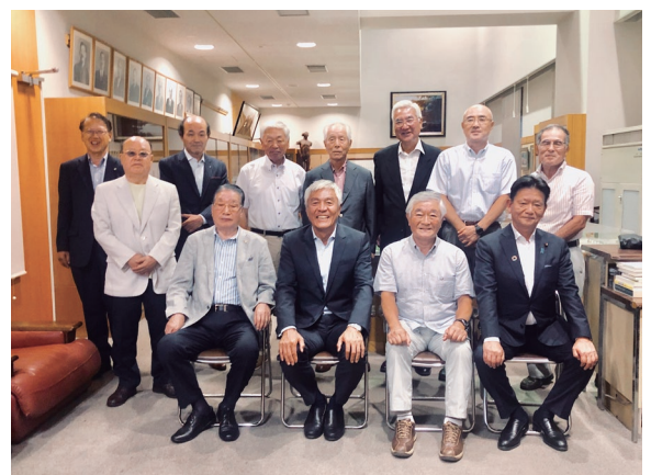
「大人の春高会」に向けてのOB会打ち合わせ 青島健太氏を囲んで