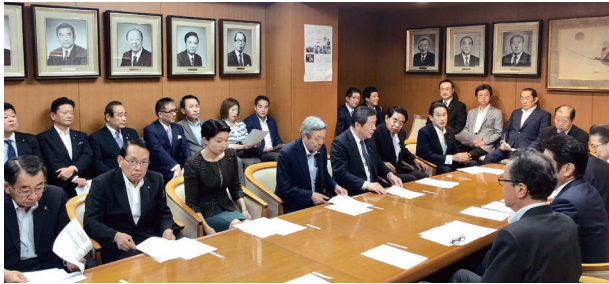
党本部役員会に出席。副幹事長として 党勢拡大に向け全力を尽くします