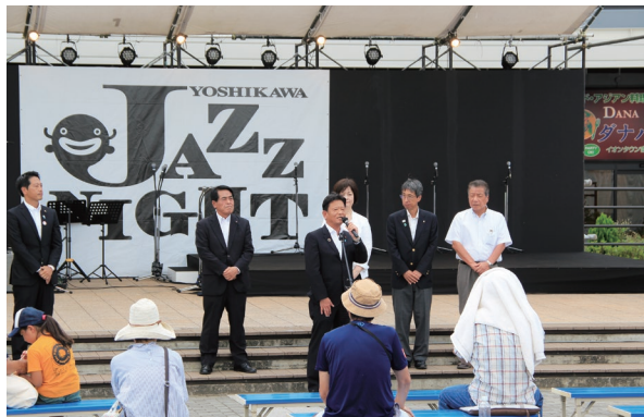
吉川JAZZナイト 商工会青年部の熱意ある運営が地元を盛り上げています