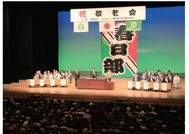
春日部市敬老会式典(庄和地区)