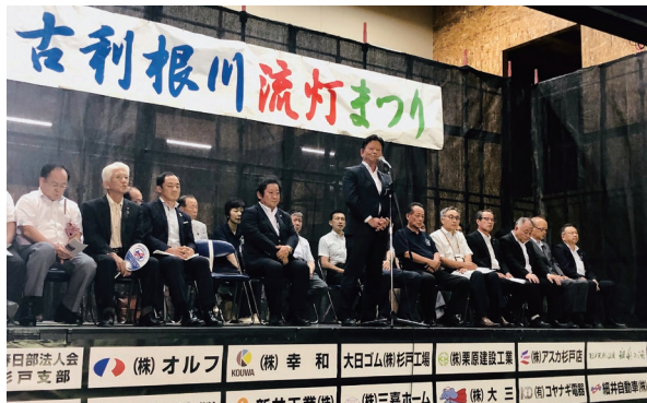
古利根川流灯まつりセレモニーにてあいさつ 地上に降った天ノ川、幻想的な風景が夏の夜を彩ります