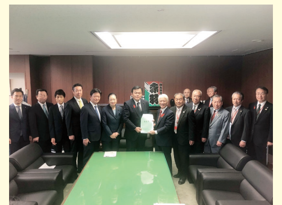
東埼玉道路建設促進期成同盟会 赤羽一嘉国土交通大臣に予算要望 沿線自治体の市長、町長、議長、経済団体も そろって地元の熱意を伝える