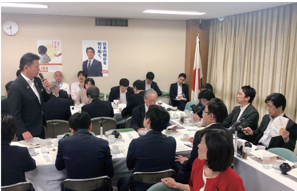
党厚生労働部会で小泉進次郎部会長(当時)と質疑応答 医療の現場の声を政策に反映していきます