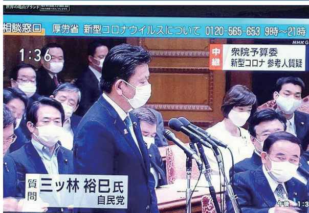
衆議院予算委員会・新型コロナウイルス感染症対策参考人質疑にて有識者会議諮問委員会の尾身茂会長と議論

● 当初3年間の金利(0.5%または1.05%) その後 ▲2%程度利下げ (既存商品比)