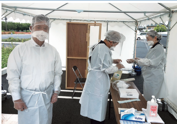
地元で設置されたPCR検査センターで医師として検査に協力