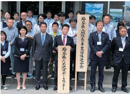
埼玉県ため池サポートセンターが設置され開所式に土地改良事業団体連合会の会長としてあいさつ。地震災害による決壊に備える適切な管理・保全の拠点です