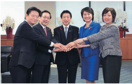
厚生労働大臣政務官に就任。塩崎恭久大臣他政務三役とともに