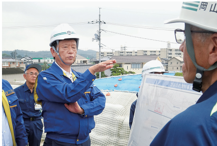
衆議院災害対策特別委員会理事として、豪雨災害が頻発する中、被害の実情と対策の進捗を現地調査