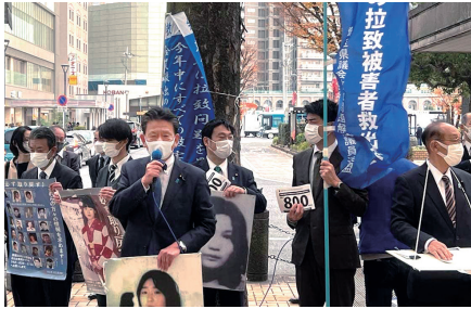
救う会埼玉の皆さんが主催する北朝鮮人権侵害問題啓発週間街頭運動に参加