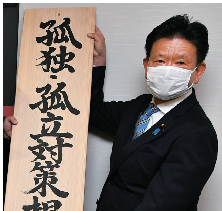
自殺者の急増など孤独の問題が深刻化する中、不安に寄り添う支援策を検討する「孤独・孤立対策担当室」が新設され、担当の副大臣に就任