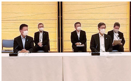
官邸での新型コロナウイルス感染症対策本部会議。菅義偉総理、関係閣僚、尾身茂分科会会長とともに内閣府副大臣として出席