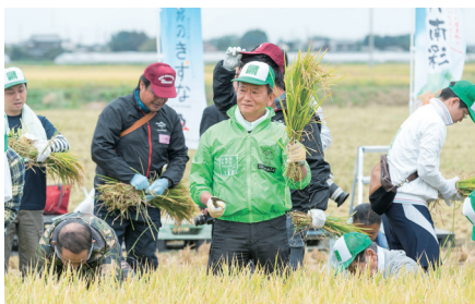
久喜市菖蒲地区で行われた「自民党米作りプロジェクト」での稲刈り。農業が国の基であることを改めて実感