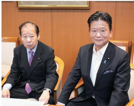
二階俊博幹事長の下、副幹事長として党勢拡大と党内調整の一翼を担う