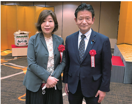
母校、日本大学の理事長に新たに就任した林真理子氏と意見交換