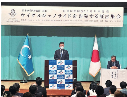
日本ウイグル国会議員連盟の事務局長として証言集会にてあいさつ