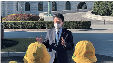
地元の小学校の国会見学。子供たちの元気な声を聞くと本当に頑張らなければ、と思えます