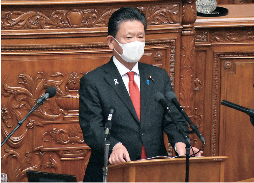
衆議院本会議に厚生労働委員長として度々登壇。 新たな感染症危機に備える感染症法改正案、障害者総合支援法改正案、難病等支援法改正案など可決した法案について委員長報告を行う