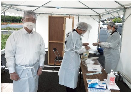
地元設置されたPCR検査センターで医師として検査に協力