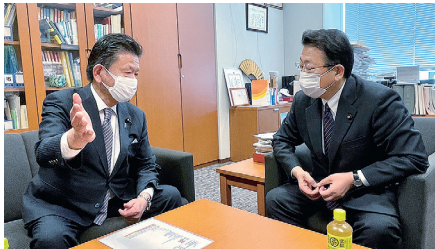
公明党埼玉県代表、西田まこと参議院議員と国土強靱化、東埼玉道路、地下鉄7号線、8号線誘致等々について意見交換