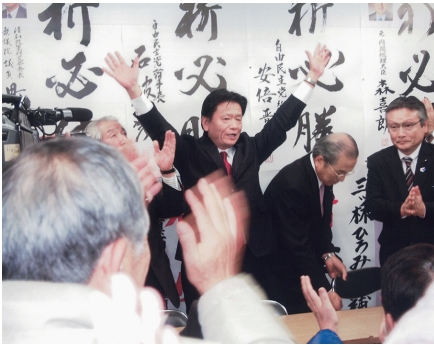
平成24年12月16日、第46回衆議院議員総選挙にて初当選を果たす