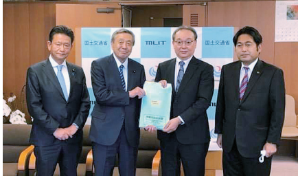
利根川治水同盟会が国土交通省へ予算要望。伊奈忠次の成し遂げた利根川東遷と治水の思いを受け継ぐ首都圏氾濫堤防強化事業を確実に進めてまいります