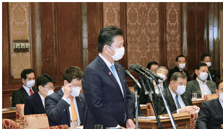
衆議院予算委員会の新型コロナウイルス感染症対策参考人質疑にて、有識者会議諮問委員会の尾身茂会長、新型コロナウイルス感染症対策専門家会議の協田隆字座長他と議論