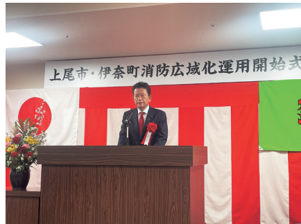
上尾市・伊奈町の消防広域化がスタート。救急や初動消防体制の迅速化が図られます