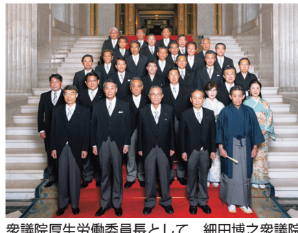
衆議院厚生労働委員長として、細田博之衆議院議長、衆議院の全委員会の委員長と共に本会議場正面で記念撮影