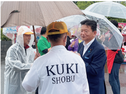
雨の中開催された菖蒲のあやめ祭り。地元の皆さまと意見交換