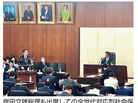
岸田文雄総理も出席しての全世代対応型社会保障制度を構築するための健康保険法等の一部を改正する法律案の質疑