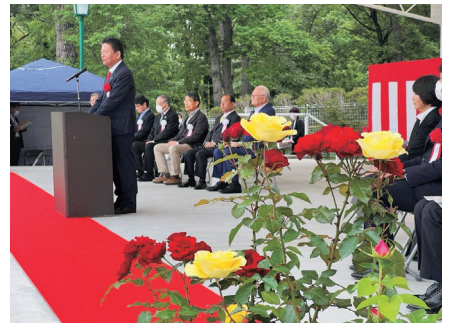
伊奈町バラまつり。イベント広場ステージ竣工式であいさつ。行き届いた手入れは地元の心意気です