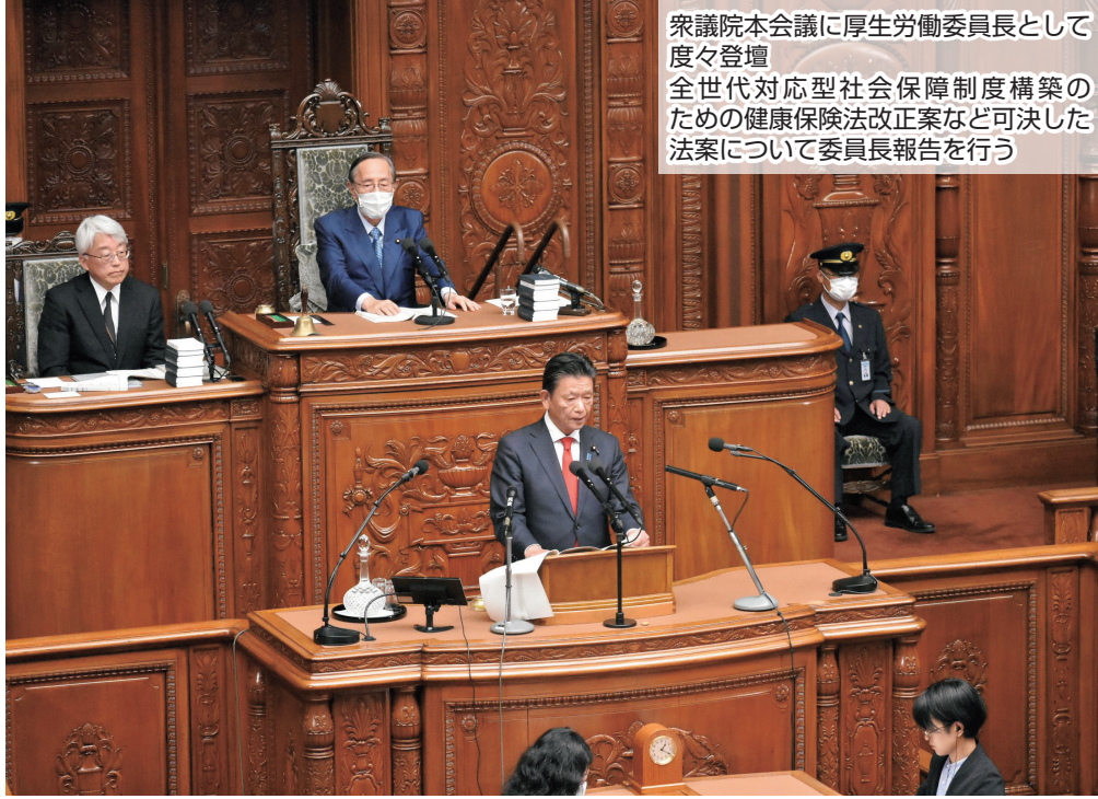
衆議院本会議に厚生労働委員長として度々登壇 全世代対応型社会保障制度構築のための健康保険法改正案など可決した法案について委員長報告を行う