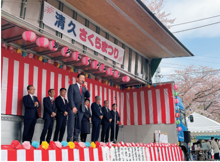
清久さくらまつり式典。新たに支部長になって初めての参加です。新しい出会いが多くありました