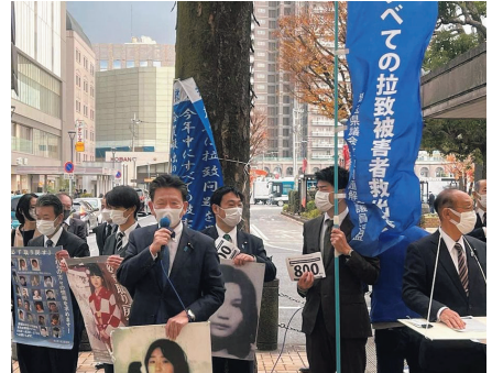
北朝鮮人権問題啓発週間、浦和駅前での救う会埼玉の大規模街頭活動、署名活動に参加