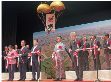
圏央道4車線化久喜白岡ジャンクション-幸手インターチェンジ開通式典