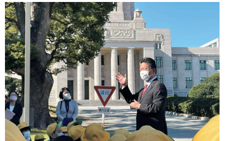
地元小学校の国会見学。子供たちの元気な声を聞くと本当に頑張らなければ、と励みになります

https://www.hi-mit-susaka.jp/ h5q1u-u-AMM//:ps