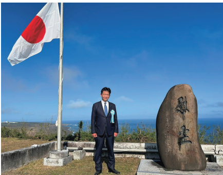
硫黄島日米戦没者慰霊追悼顕彰式に参列。衷心より英霊の御霊に哀悼の誠を捧げます