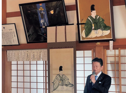
白岡市、野牛文化財愛好会総会、新井白石公の地元での偉業を後世に語り継いでいます