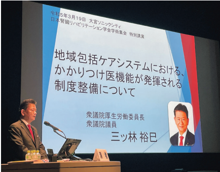
地域医療の専門家として、学会でかかりつけ医に関する講演