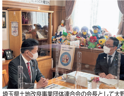
埼玉県土地改良事業団体連合会の会長として大野元裕知事に要望。各種施設の防災減災、老朽化対策や圃場整備、農業を守るために頑張ります