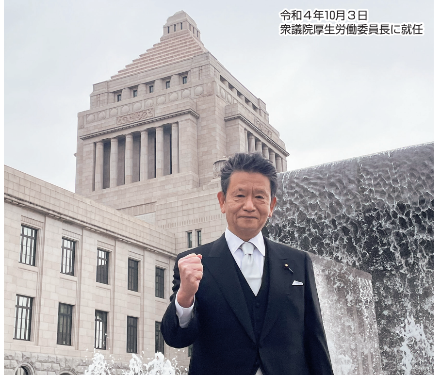
令和4年10月3日 衆議院厚生労働委員長に就任