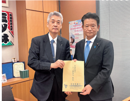
日本医師会の松本吉郎会長より、物価高騰から地域医療を守るための要望を受ける