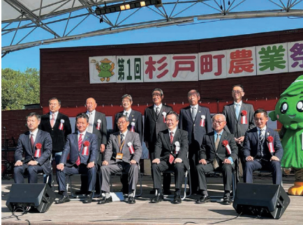
第1回杉戸町農業祭。地産地消の推進が地域の発展につながります