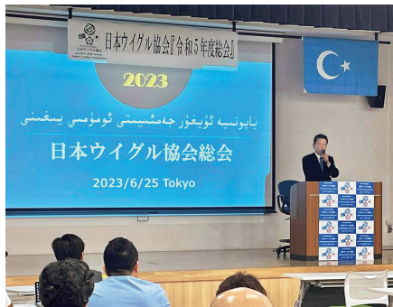
日本ウイグル協会総会にて、日本ウイグル国会議員連盟事務局長としてあいさつ