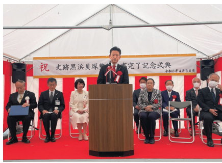
黒浜貝塚整備工事完了記念式典。未来に遺すべき、縄文人の生活を知るための貴重な史跡です