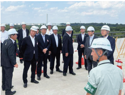
斉藤鉄夫国土交通大臣、石井啓一元大臣と建設中の三郷流山橋有料道路を視察