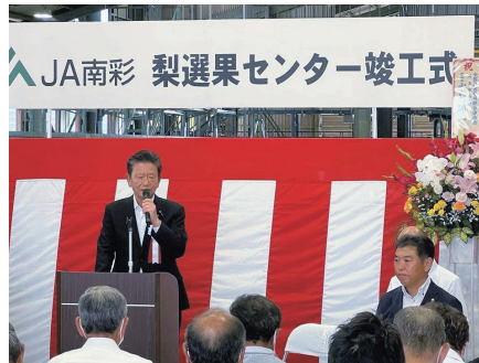
JA南彩 梨選果センター竣工式。全国でも有数の梨の産地として、競争力の強化に大いに期待