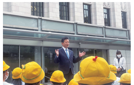
地元小学校の国会見学。子供たちから「頑張ってください」と激励されるのは本当に嬉しい限りです