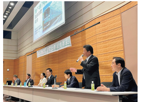
地下鉄7号線延伸促進議員連盟。岩槻、そして蓮田へと、延伸実現に全力で頑張ります!