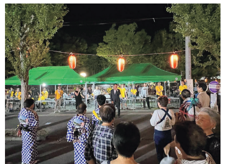
各地の夏まつり、盆踊りに参加。地元の皆さまと親しくさせていただきました(左から、伊奈まつり2023、幸手八坂神社祭礼の花山、杉戸夏まつり、宮代町民まつり)