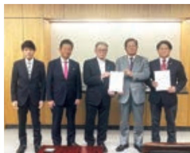
10月10日、白岡市役所火災再建に向けて藤井栄一郎白岡市長、大島勉議長(当時)とともに特別交付税の確実な交付執行へ富樫博之総務副大臣に要望活動