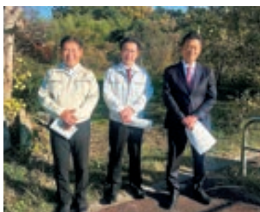
11月17日、久喜市と杉戸町を新たに結ぶ久喜都市計画道路、下野久喜線の進捗状況を、梅田修一久喜市長、窪田裕之杉戸町長とともに視察。地元の発展に全力を尽くす、そのために頑張ります！