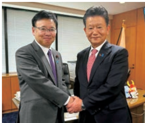
上野賢一郎厚生労働大臣に陳情要望活動(12月19日)

賃金・物価上昇で厳しい経営状況にある医療機関・介護施設などに対する「医療・介護等支援パッケージ」として、令和7年度補正予算で1兆3649億円が措置されたことを受けて、さらに本丸である令和8年度診療報酬改定に向けて、現場の声を切実に訴えた