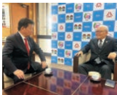
11月11日、伊奈町役場に大島清町長を訪問、地元課題についてさまざまなご指導をいただく。令和4年に選挙区の区割り新13区になってから、度々間断なく意見交換等をさせていただいています